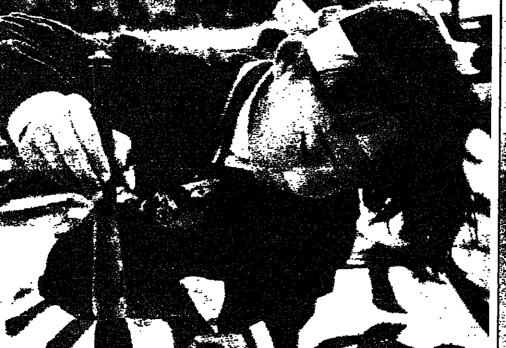
اكثر من ٧٥٠٠ ولد شاركوا امس الاول في معرض الخطوط الذي اقيم في قاعة نيبون بودوكان بواوكيو. ويبدو ايا كويبايتي، ٨٠ سنوات، وهي تراقب سيلان الحبر من فرشة الكتابة الكبيرة. والمعرض يقام كل عام في بداية السنة الجديدة. طوكيو - ر